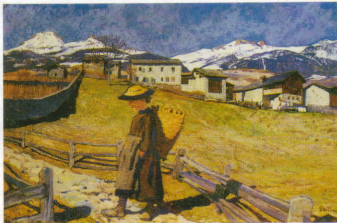
Edmond Bille, Premier Printemps , huile sur carton, 1907, 54 x 81 cm, Sion, Musée cantonal des beaux-arts.

Dès le 18 octobre, plusieurs manifestations simultanées rendent hommage à quatre créateurs qui ont marqué l'histoire culturelle valaisanne et suisse au XX e siècle. Leurs points communs? Ils appartiennent tous à la famille Bille, ils montrent une sensibilité aiguë aux rapports entre l'homme et la nature, ils jettent des passerelles entre les différentes formes d'expression artistique. Au programme: trois expositions à Sion et à Finges, un festival de théâtre à Sierre, quatre publications , des conférences, des parcours enfants et bien d'autres choses encore.