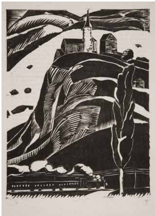
Rarogne, 1927 Xylographie