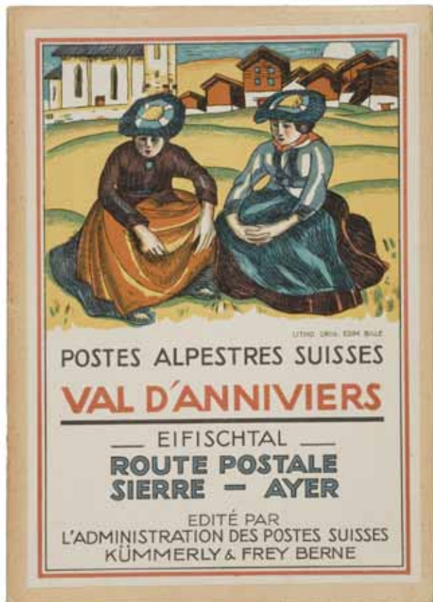
Val d'Anniviers, 1931 Couverture lithographiée

Ci-contre : Meubles Perrenoud, 1930 Affiche lithographiée