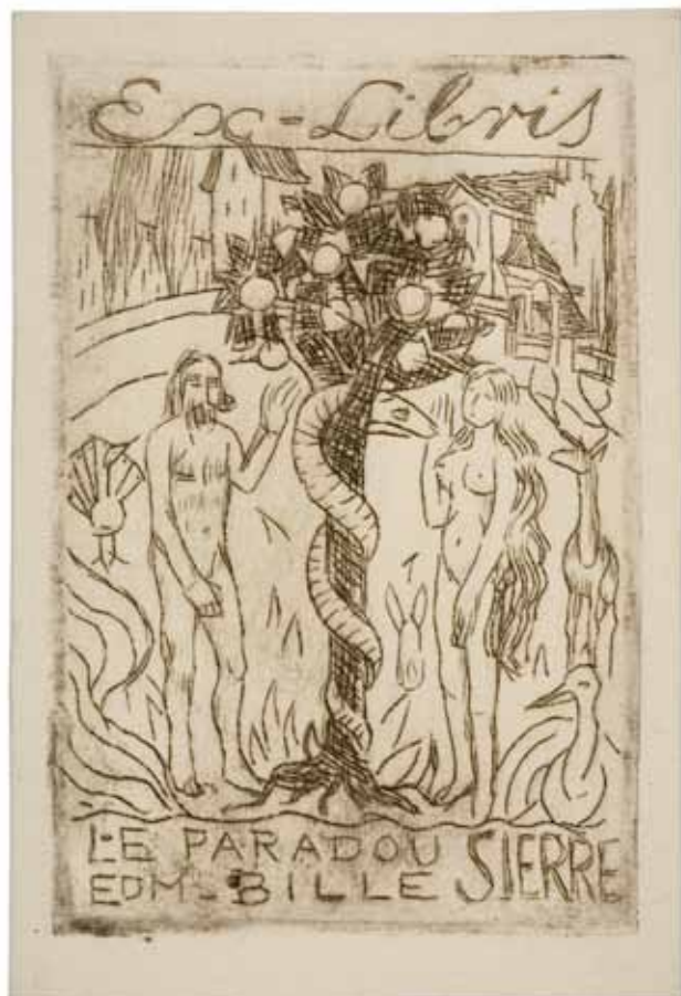
Ex-libris, 1920 Eau-forte