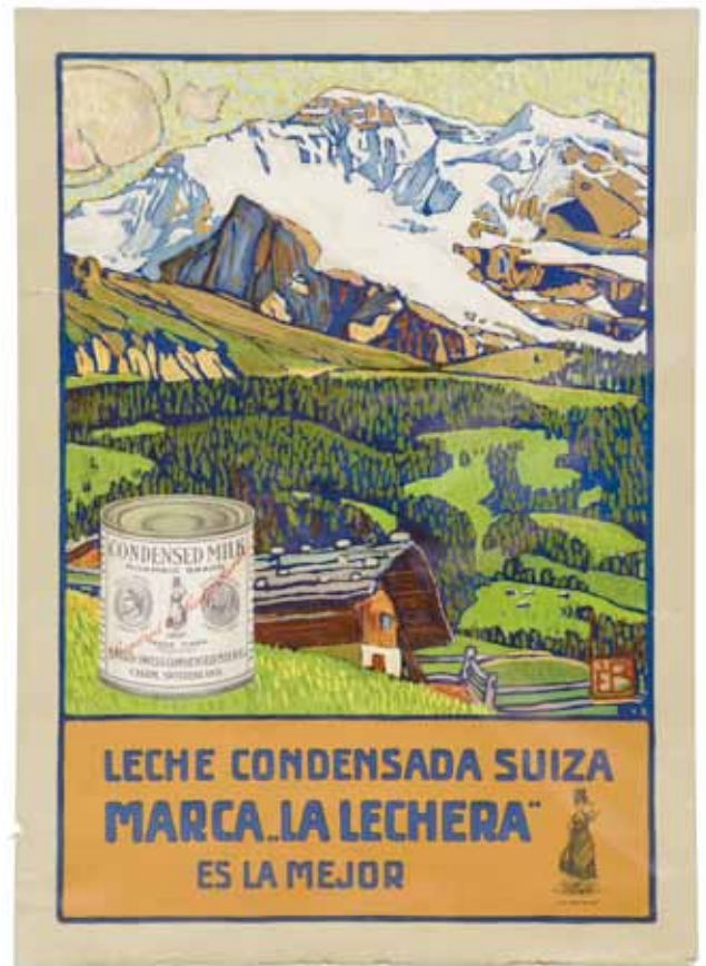
Lait condensé La laitrière Affiche lithographiée

Une extension intéressante du domaine de l'illustration est constituée par les nombreux diplômes, étiquettes de vin, couvertures de livres et de plaquettes, commandés par les clients les plus divers: industriels, organisateurs de manifestations, régies fédérales (PTT, CFF) ou éditeurs, pour ce que l'on appellerait aujourd'hui des travaux de graphisme.