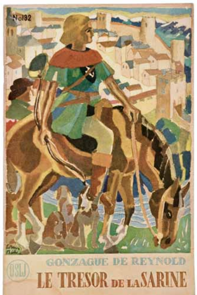
Le trésor de la Sarine Couverture d'un cahier de lecture